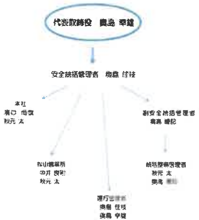
(有) 奥島観光 安全管理体制組織図